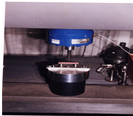
شکل ۲: اعمال نیرو توسط اینسترون بر روی نمونه

که در این فرمول استحکام عرضی یا استحکام شکست = S بر حسب N/mm 2 نیروی اعمال شده جهت شکست نمونه = W بر حسب نیوتن فاصله دو میله عمودی به طول ۵۰ میلی متر = L بر حسب میلی متر