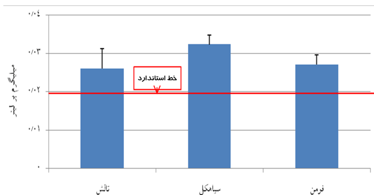
نمودار ۳. مقایسه میانگین غلظت فلز نیکل در آب مصرفی ماهی در سه کارگاه تالش - سیاهکل و فومن و با استاندارد جهانی بر حسب میلی‌گرم بر لیتر