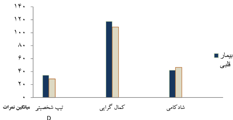
نمودار ۱. میانگین نمرات تیپ شخصیتی D، کمال‌گرایی و شادکامی در دو گروه مورد مطالعه