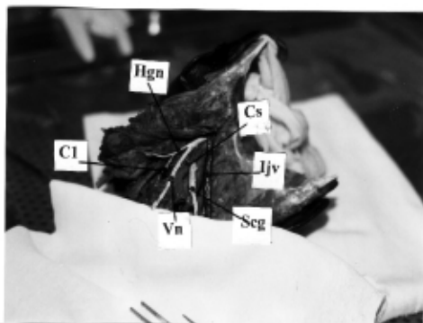
تصویر ۲: نمای خلفی خارجی بخش فوقانی گردن را در کاداور فیکس شده بعد از رنگ آمیزی نشان می دهد. حروف اختصاری بکار رفته به بشرح زیر است. Cs = Carotid sinus, Vn = Vagus nerve, Seg = Superior cervical ganglion Hgn = hypoglossal nerve, Ijv = Internal jugular vein در این تصویر، علاوه بر تنه مشترک عصب هایپوگلووس و واگوس، شاخه C1 برای قوس عصبی گردنی (Ansa cervicalis) نیز بخوبی دیده می شود.