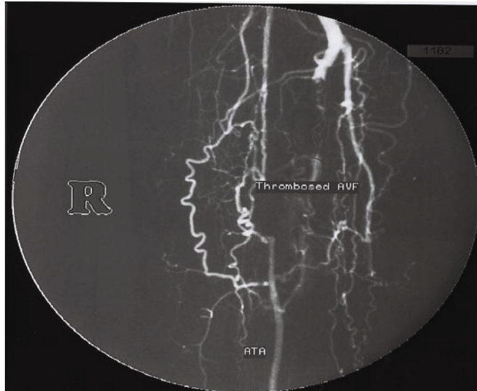
تصویر ۳. بسته شدن فیستول شریانی- وریدی پس از آمبولیزاسیون کامل

پس از چند دقیقه haCoil به صورت کامل در محل ترومبوزه شده و فیستول به صورت کامل بسته شد (تصویر ۳).