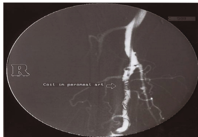
تصویر ۲. آنژیوگرافی بعد از عمل آمبولیزاسیون

که طی آن ارتباط غیرطبیعی بین شریان- وریدی ساق پا راست دیده می شود